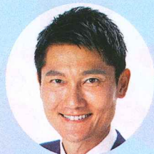
前環境大臣政務官 参議院議員 朝日 けんたろう