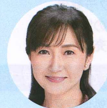
外務大臣政務官 参議院議員 生稻 晃子